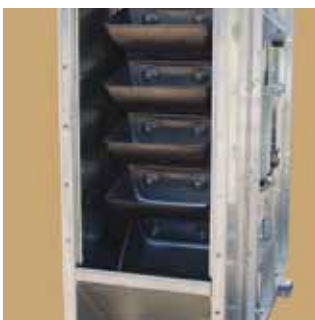
Antistatický korčkový pás s oceľovými korčekmi.