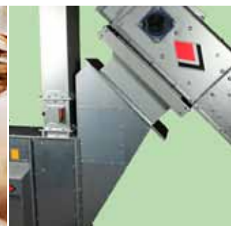
Napájacia násypka medzi dopravníkom a elevátorom.