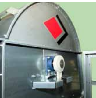
Brzda elevátora na remenici v hlave elevátora.