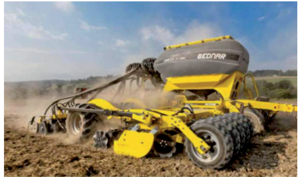
BEDNAR OMEGA OO 6000L výkonnou sejačkou s výbavou, ktorá patrí medzi špičku na trhu.

diska ekonomického nám vychádzala kúpa tohto stroja najlepšie vzhľadom k výbave a konštrukčnému riešeniu. K dispozícii bola taktiež bezkonkurenčná dodatočná výbava, ktorú sme si navo-