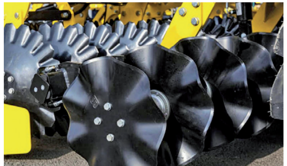
Coulter sekcia, ktorú výrobca ponúka ako doplnkovú výbavu zaručuje dokonalú prípravu osivového lôžka i v ťažších a vlhkých podmienkach.